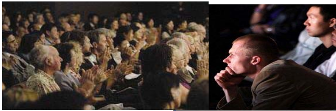
国外观众全身心地投入看演出

一个节目报幕时才渐停止下来。其中当《觉醒》节目结束时，观众爆发出长时间的掌声，演员们在不断的掌声中二次谢幕。整场演出结束时，观众起立鼓掌，热烈的掌声催动帷幕三度拉起，让全体神韵演员三次谢幕，观众才依依不舍的逐渐离去。