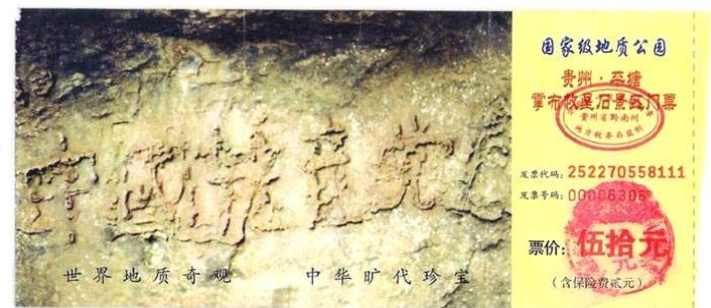
贵州省平塘县掌布乡“藏字石”风景区门票图案

由此我想到了以前看过一张门票，上面印着一个带字的石头。那是贵州省平塘县掌布乡“藏字石”风景区的门票（下图），门票上的图片是二零零二年六月在掌布乡发现的距今二亿七千万年的“藏字石”，五百年前崩裂的巨石断面内有六个大字：中国共产党亡。此奇观被一百多家报纸、电视、网站报道，只不过没人敢提那个“亡”字，但每一个亲眼见到的人都心知肚明。看到这张门票时我就在想：这不是老天说话了吗？那么今天盛传的“天灭中共，退党保命”不就是老天要传达给人的信息吗？不管通过谁的口传达，都是在传达天意，人只有遵从天意才明智。