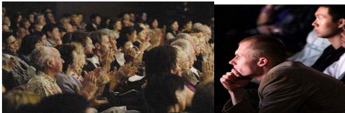
国外观众全身心地投入看演出

一个节目报幕时才渐停止下来。其中当《觉醒》节目结束时，观众爆发出长时间的掌声，演员们在不断的掌声中二次谢幕。整场演出结束时，观众起立鼓掌，热烈的掌声催动帷幕三度拉起，让全体神韵演员三次谢幕，观众才依依不舍的逐渐离去。