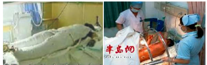
央视中的“自焚者”被包裹得严密。