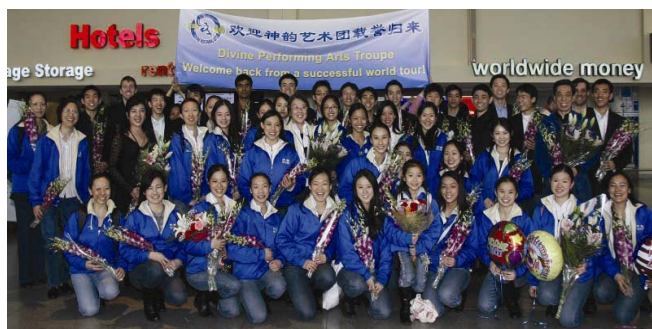
神韵巡回艺术团的演员们

在这南半球的秋天，神韵艺术团带领奥克兰的观众穿越时空，重温了五千年中华传统文化纯善、纯美的精髓，也给更多的中国人提供了一个了解事实真相的好机会。尤其在海外，能看到中华文化的精彩重现，让我们感受到了作为一名中国人的自豪感。