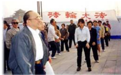
图为 98 年 5 月 15 日伍绍祖亲赴法轮功发祥地长春考察。

1998 年 5 月 15 日，国家体育总局局长伍绍祖亲赴法轮大法发祥地长春考察。98 年 9 月国家体总抽样调查法轮功修炼人 12553 人，疾病痊愈和基本康