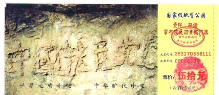
贵州省平塘县掌布乡“藏字石”风景区门票图案

由此我想到了以前看过一张门票，上面印着一个带字的石头。那是贵州省平塘县掌布乡“藏字石”风景区的门票（下图），门票上的图片是二零零二年六月在掌布乡发现的距今二亿七千万年的“藏字石”，五百年前崩裂的巨石断面内有六个大字：中国共产党亡。此奇观被一百多家报纸、电视、网站报道，只不过没人敢提那个“亡”字，但每一个亲眼见到的人都心知肚明。看到这张门票时我就在想：这不是老天说话了吗？那么今天盛传的“天灭中共，退党保命”不就是老天要传达给人的信息吗？不管通过谁的口传达，都是在传达天意，人只有遵从天意才明智。