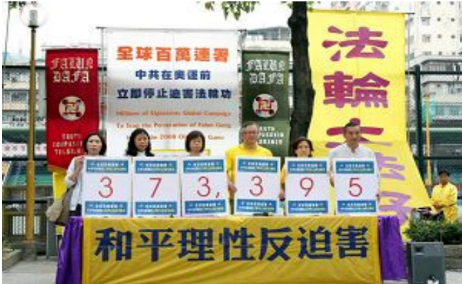
香港学员在五月一日反迫害集会上公布最新联属数字

CIPFG 希望在七月二十日之前，征得全球大约一百万人签名，然后将联署书向国际奥委会、联合国等国际机构、各国政府及议会提交，促请他们采取实际有效的行动，协助中国大陆法轮功学员重获人权和自由。