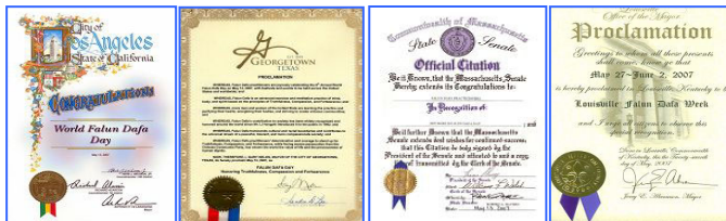
上图为美、加各级政府发来的贺状褒奖法轮大法。

1992年5月13日，是法轮大法开传的日子，也是法轮功创始人李洪志师尊的华诞。十六年前的这一天，李洪志师尊在吉林长春首次把法轮大法面向社会传出，以“真善忍”为修炼原则，开启人们的心智，使上亿人的道德回升，体魄强健。法轮大法至今已洪传世界80多个国家和港澳台地区，至2008年3月，各国政府机构、团体组织对法轮大法及其创始人颁发的褒奖与支持议案信函已达2945项。法轮功主要著作《转法轮》、《法轮功》已翻译成30种语言在世界各地出版发行。并可在计算机网络上免费下载、复制。2000年5月13日，第一个“世界法轮大法日”诞生。每年的这一天，美、欧、亚、澳洲的各国法轮功学员举行盛大游行、文艺演出等活动，表达对师父的感恩，欢庆“世界法轮大法日”。