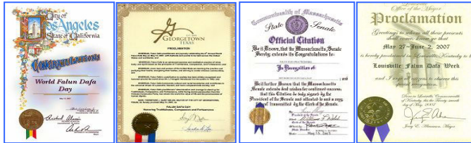
上图为美、加各级政府发来的贺状褒奖法轮大法。

1992年5月13日，是法轮大法开传的日子，也是法轮功创始人李洪志师尊的华诞。十六年前的这一天，李洪志师尊在吉林长春首次把法轮大法面向社会传出，以“真善忍”为修炼原则，开启人们的心智，使上亿人的道德回升，体魄强健。法轮大法至今已洪传世界80多个国家和港澳台地区，至2008年3月，各国政府机构、团体组织对法轮大法及其创始人颁发的褒奖与支持议案信函已达2945项。法轮功主要著作《转法轮》、《法轮功》已翻译成30种语言在世界各地出版发行。并可在计算机网络上免费下载、复制。2000年5月13日，第一个“世界法轮大法日”诞生。每年的这一天，美、欧、亚、澳洲的各国法轮功学员举行盛大游行、文艺演出等活动，表达对师父的感恩，欢庆“世界法轮大法日”。