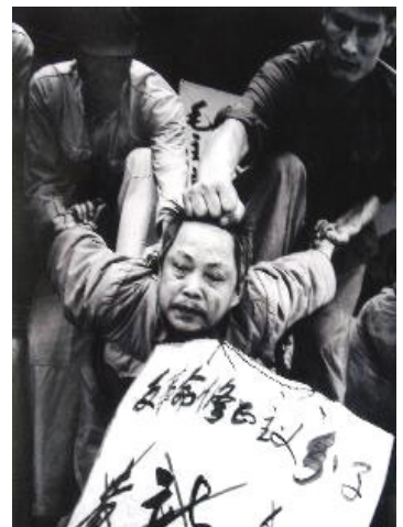
“文革”中典型批斗场面

这个所谓的“专家”又说：“邪教反人道的性质导致出现大规模的屠杀、自杀和伤害行为。”这就更是中共的写照了。中共进行血腥的屠杀，造成过大量的自杀、大饥荒，共产党是真正反人道的邪党。法轮功禁止杀生和伤害他人，并明确指出