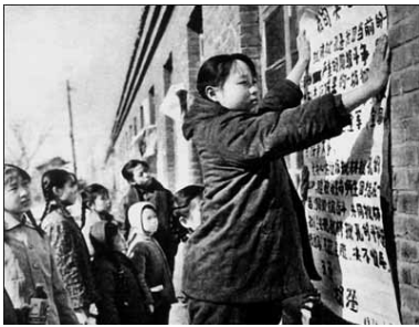
“文革”中小学生也贴大字报

在四川地震发生的当天，全国民众都在关注震灾时，中共喉舌新华网在新闻主页除了头条刊出一贯的吹捧领导人“伟光正”的报导外，还在显著位置刊出攻击法轮功的文章。该诬蔑