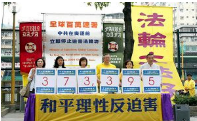
香港学员在五月一日反迫害集会上公布最新联属数字

CIPFG 希望在七月二十日之前，征得全球大约一百万人签名，然后将联署书向国际奥委会、联合国等国际机构、各国政府及议会提交，促请他们采取实际有效的行动，协助中国大陆法轮功学员重获人权和自由。