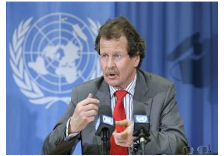
联合国酷刑问题特派专员诺瓦克先生（Manfred Nowak）

女士和联合国酷刑问题特派专员曼弗瑞德·诺瓦克先生（Manfred Nowak）一起做出以上要求并且写入2008年度报告中，递交给联合国人权议会，他们将就这些问题继续和中国政府做下一步的交涉。