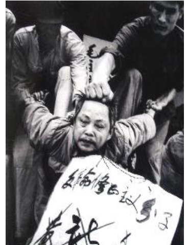
“文革”中典型批斗场面

这个所谓的“专家”又说：“邪教反人道的性质导致出现大规模的屠杀、自杀和伤害行为。”这就更是中共的写照了。中共进行血腥的屠杀，造成过大量的自杀、大饥荒，共产党是真正反人道的邪党。法轮功禁止杀生和伤害他人，并明确指出