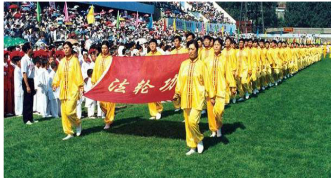
法轮功学员在亚州体育节开幕式上列队入场 (沈阳 1998)

法轮大法洪传世界，超越种族、国界，真修者无不身心受益，道德回升，这是全人类之福！