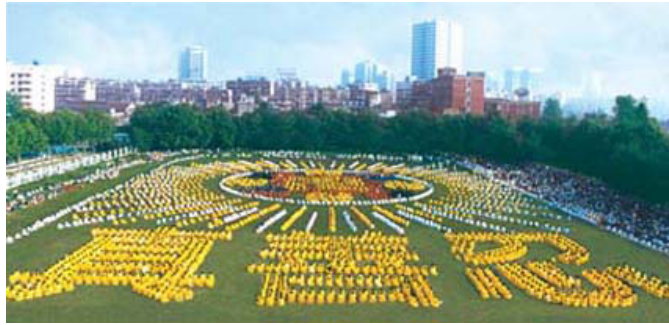
湖北武汉，约5000名法轮功学员集体炼功，组排“法轮图形”和“真善忍”等（1997）

期学习班，将法轮大法公诸于世。法轮大法以宇宙特性“真善忍”指导人修心向善，从根本上祛除病疾、净化身心，使真修者最终达到返本归真的境界。从那时开始到1994年12月，李洪志先生先后由各地官方气功科学研究会邀请，在中国举办54个讲法面授班，学员几十万人。至1999年短短7年，由于其神奇的功效，人传人，心传心，修者近亿，遍及全国各阶层。闻者寻之、得者喜之；人们因修炼法轮功而无疾无病，人们因信仰“真、善、忍”而无私无恨。