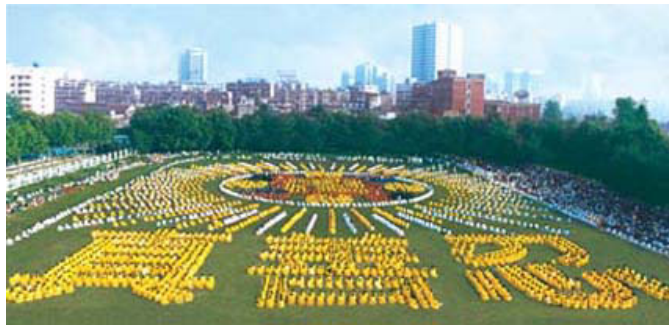
湖北武汉，约5000名法轮功学员集体炼功，组排“法轮图形”和“真善忍”等（1997）

把自己打扮成“奥林匹克精神”的发扬者，去欺骗世界。当被欺骗的人们对中共的伪装给以默认和肯定时，中共又反过来以此作为其执政的合法性依据，从而更加肆无忌惮的迫害自己的民众。