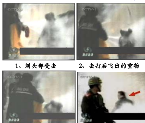
3、手摸被打后的头部 4、击打者仍保持用力姿势

如果把中央电视台---CCTV《焦点访谈》提供的录像镜头放慢可以看见，被官方媒体称为自焚而死的刘春玲身上的火焰已经基本熄灭，突然，有人用物体