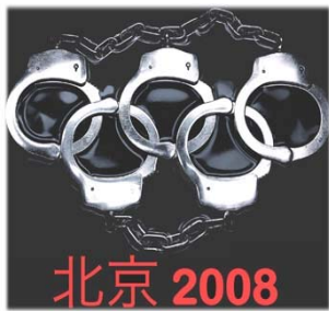
▲中共对外打着“反对把奥运政治化”的幌子，对内却借机加剧人权迫害，使奥运沦为名副其实的“手铐奥运”。

中共中央政法委这份秘密印发了四十份的密文说，“为奥运会成功举办营造良好的社会环境”，各省“要按照属地管理和‘谁主管、谁负责’的原则，层层签订目标管理责任书，一项一项地明确责任，一项一项地研究措施，一项一项的落实到责任单位和责任人。”密文引发更多死亡案例。