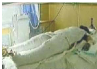
央视《焦点访谈》中的“自焚者”被包裹得严密。