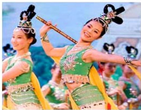
Tanz-Tradition aus dem Reich der Mitte

送您一句真言 为您生命永远 愿您明白真相 全家幸福平安 “法轮大法好 真善忍好”