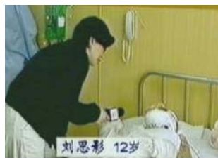
气管切开还能说、唱？记者采访不穿防护服，不戴口罩