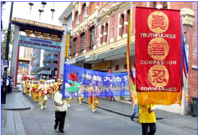
图：澳洲法轮功学员庆祝二零零八年世界法轮大法日

【明慧网】2008年5月13日是第九届世界法轮大法日，也是李洪志先生的五十七岁生日。据不完全统计，这一天，数以万计的中国大陆法轮功学员及其家人冒着生命危险，成功地突破网络封锁，通过明慧网发表了四千多份给李洪志先生的生日问候、贺卡、闪画、诗歌，表达大家发自内心的感恩大法师父给自己、家人及整个社会带来的健康祥和。同时，欧洲、北美、亚太等各国的法轮功学员也纷纷举办游行、文艺表演等庆祝活动，与当地民众共享同贺法轮大法的美好。