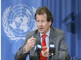
联合国酷刑问题特派专员诺瓦克先生 (Manfred Nowak)

据明慧网 2008 年 5 月 7 日的报道，两位联合国特派专员日前重申关于中共活体摘取法轮功学员器官的指控，并且再次要求中共政府就两个问题做出全面的解释。一是关于从法轮功学员身上摘取器官用于中国各大医院器官移植的指控；二是要求中共政府拿出从 2000 年开始中国器官移植数量猛增所用的器官的来源。特派专员指出 2000 年到 2005 年之间是法轮功学员被迫害最残酷的阶段，这也是中国器官移植手术暴增的阶段。