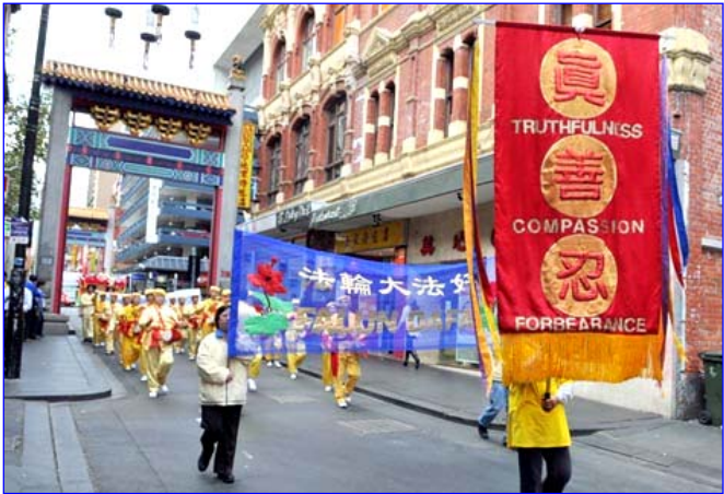
图：澳洲法轮功学员庆祝二零零八年世界法轮大法日

【明慧网】2008年5月13日是第九届世界法轮大法日，也是李洪志先生的五十七岁生日。据不完全统计，这一天，数以万计的中国大陆法轮功学员及其家人冒着生命危险，成功地突破网络封锁，通过明慧网发表了四千多份给李洪志先生的生日问候、贺卡、闪画、诗歌，表达大家发自内心的感恩大法师父给自己、家人及整个社会带来的健康祥和。同时，欧洲、北美、亚太等各国的法轮功学员也纷纷举办游行、文艺表演等庆祝活动，与当地民众共享同贺法轮大法的美好。