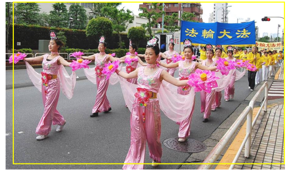
日本法轮功学员在东京举行游行活动庆祝世界法轮大法日

“照像可是个苦差事，几千名学员都要跟师父照像，谁也不放弃。就这样，师父被请来请去的。当时烈日当空，炎热袭人，师父从不烦，总是祥和的、慈悲的、笑容满面的走来走去与大家一起照像。”