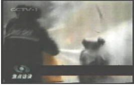
2、击打后飞出的重物