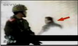
4、击打者仍保持用力姿势

就这样，几年来我们互通有无的看了不少真相资料，明白了许多道理，对法轮功学员用自己的积蓄，冒死讲真相的行为，从不理解到理解，直到从心里很佩服他们，觉得他们个个都是好样的，都好的勇气和毅力，确实值得尊敬。特别是有一次亲见一位腿脚不太灵便的老人，还上楼下楼，东奔西跑的发资料时，除了感动和佩服，我的第一念就是，连这样的老太太都风雨无阻的讲真相，信心还那么大，可想这个群体的难能可贵，该是多么了不起！