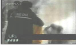
3、手摸被打后的头部