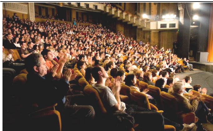
▲零八年四月八日晚，神韵巡回艺术团在罗马尼亚布加勒斯特国家大剧院的演出盛况空前，各界一致赞誉。