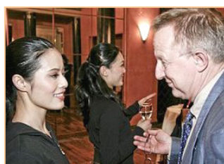
▲多位瑞典政要在本国观看了神韵演出，国会议员斯特凡·丹尼逊表示，演出汇集了中国传统精华。图为他与神韵演员交谈。

就事无巨细的享受服务伺候，服药、喝水得别人喂，吃桔子得一瓣一瓣往他嘴里送，洗脚脱袜、搓脚灰等都得别人代劳。玉芳精心护理数月，没有怨心，其风范让全家人敬佩有加。