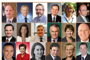
▲神韵晚会为澳洲观众带来了中华传统文化的纯善纯美。澳大利亚六十多位政要致信欢迎神韵艺术团到来，并祝贺演出圆满成功。