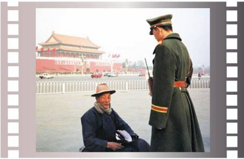
步行到天安门广场为法轮功和平请愿的老人

“我们只想到北京告诉政府，我们地方偏远又很穷，无钱看病，这么好的功法，请政府不要反对，让