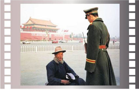
步行到天安门广场为法轮功和平请愿的老人

“我们只想到北京告诉政府，我们地方偏远又很穷，无钱看病，这么好的功法，请政府不要反对，让