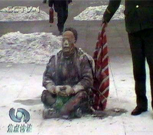
▲自焚伪案中王进东两腿中间装满汽油的塑料雪碧瓶居然完好无损

人都不是人，是被专制的对象。人们在长期的灌输中失去了独立思考的能力，所以就出现人类历史上罕见的父子相残、夫妻反目、酷刑、杀戮的文革时代。其实，“仁、义、礼、智、信”，才是中国人为人的根本、齐家治国平天下的所依啊！