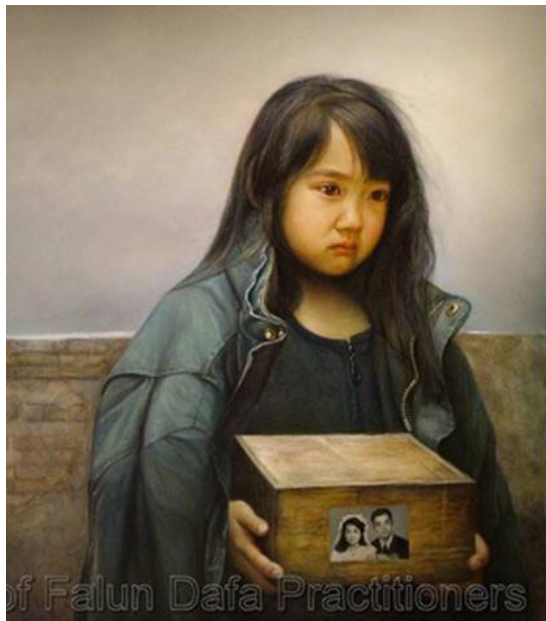
董锡强,《孤儿泪》, 油画, 48 x 48 英尺 (2006 年)