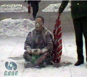
▲自焚伪案中王进东两腿中间装满汽油的塑料雪碧瓶居然完好无损

人都不是人，是被专制的对象。人们在长期的灌输中失去了独立思考的能力，所以就出现人类历史上罕见的父子相残、夫妻反目、酷刑、杀戮的文革时代。其实，“仁、义、礼、智、信”，才是中国人为人的根本、齐家治国平天下的所依啊！