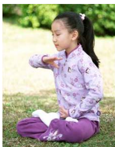
信仰无罪 停止迫害