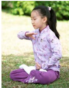
信仰无罪 停止迫害