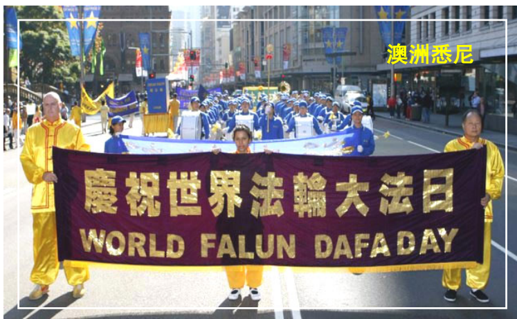
上图：澳洲法轮功学员庆祝二零零八年世界法轮大法日

加拿大总理斯蒂文·哈珀、多位国会议员和省议员给法轮功学员发来贺信，哈珀赞扬法轮功修炼者与全社会分享以真、善、忍的高尚理念为基础的传统。议员们在贺信中说：在八十多个国家，有各行各业的民众修炼法轮大法，全世界上亿人选择法轮大法作为他们生活的一部份，法轮大法给他们带来了健康、快乐和富有意义的生活。◇