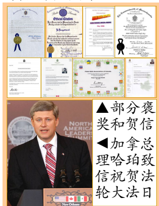
▲部分褒奖和贺信 ▲加拿大总理哈珀致信祝贺法轮大法日

【明慧网】二零零八年五月十三日“世界法轮大法日”来临之际，美国、加拿大政要纷纷发来褒奖或贺信，祝贺法轮大法传世十六周年。