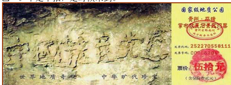
左图为贵州省平塘县掌布乡国家地质公园门票

从天理看： 善恶报应的天理决定了作恶多端的中共必遭天惩。中共窃国以来，破坏道德，打击善良，迫害正信，毒害人民。自然环境被强力破坏，传统道德丧失殆尽，贪污腐败盛行、黑社会、吸毒、卖淫充斥中国大地，人民的合法权利、言论自由被剥夺。这一切都是不信神佛、战天斗地的中共的邪恶统治带来的恶果。如今，中共祸乱中国半个多世纪，在历次运动中造成了八千万中国人非正常死亡，更甚者迫害正信——镇压法轮功，残害这些修炼人，真是逆天叛道，自己选择了自灭的命运。善恶到头终有报，“天灭中共”实乃天意之必然。