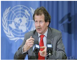
联合国酷刑问题特派专员诺瓦克先生 (Manfred Nowak)

据明慧网 2008 年 5 月 7 日的报道，两位联合国特派专员日前重申关于中共活体摘取法轮功学员器官的指控，并且再次要求中共政府就两个问题做出全面的解释。一是关于从法轮功学员身上摘取器官用于中国各大医院器官移植的指控；二是要求中共政府拿出从 2000 年开始中国器官移植数量猛增所用的器官的来源。特派专员指出 2000 年到 2005 年之间是法轮功