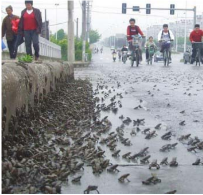
《华西都市报》2008年5月10日报导绵竹市西南镇出现了大规模的蟾蜍迁徙。

在地震前一星期，四川阿坝地区民间已经有即将地震的传言，但是在当地百姓询问地震信息时，却被视为谣言。在2008年5月9日，中共四川省政府的网站上居然公开的进行了所谓的“地震辟谣”，宣称当地没有地震。人民失去了自防自救的机会。结果3天后，大地震就在当地发生了。