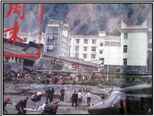
▲老旧灰暗的中学教学楼倒塌了，后面露出光亮气派的办公楼（四川省汶川县）

幅照片我看了几遍，是在汶川县漩口镇拍的，这幅照片中，前面是一所倒塌的老旧灰暗的中学教学楼，一些人在楼前抢救受伤的学生，而在倒塌的教学楼后面却露出了一座光亮，气派的办公楼，不但没有被震倒、震塌，墙上几乎都看不到裂纹。这说明政府办公楼是多么的牢固。