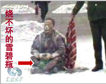
中共导演“自焚伪案”，煽动民众仇恨，为迫害法轮功制造借口

如果我们回顾一下，中共自以暴力手段夺取政权以来，多少次为了自己“政权”的稳定不顾老百姓的生死，隐瞒事实真相，利用控制媒体，利用媒体造假，欺骗民众，从隐瞒