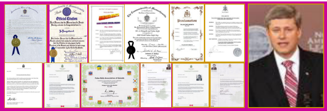
左：部分褒奖和贺信 右：加国总理哈珀致信贺大法日

加拿大总理哈珀赞扬法轮功修炼者与全社会分享以真、善、忍的高尚理念为基础的传统；议员们在贺信中说：法轮大法给八十多个国家的上亿人带来了健康、快乐和富有意义的生活。美国麻州众议院的褒奖决议中写道：法轮大法是一个基于宇宙特性“真、善、忍”的古老修炼方法。修炼者在最恶劣的环境下表现出的大善大忍，已感动了本市、本州、美国和世界人民的心。