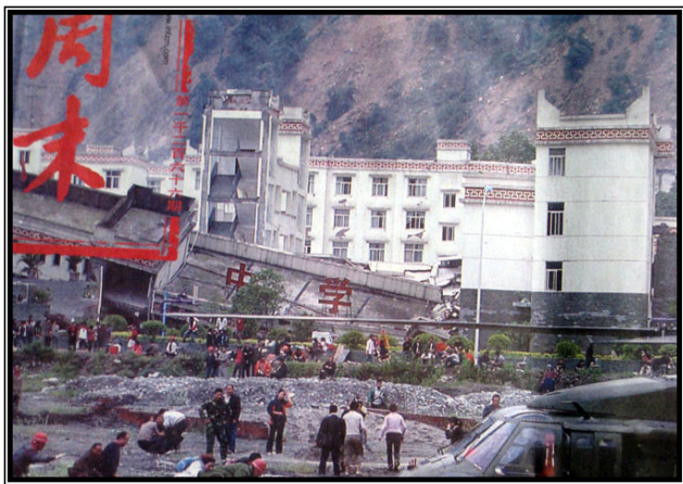
倒塌的中学后面露出了坚固豪华的办公楼

【明慧网】5月21日，洛杉矶部分法轮功学员和支持者在中共领事馆前集会，谴责中共利用其在海外的特务机构，攻击法轮功学员以及参加声援中国民众退党集会的华人。