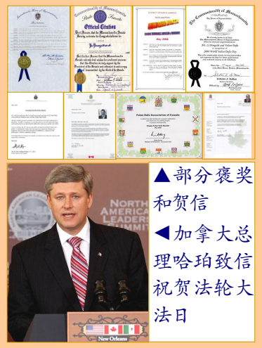
▲部分褒奖和贺信 ◀加拿大总理哈珀致信祝贺法轮大法日

加拿大总理斯蒂文·哈珀、多位国会议员和省议员给法轮功学员发来贺信，哈珀赞扬法轮功修炼者与全社会分享以真、善、忍的高尚理念为基础的传统。议员们在贺信中说：在八十多个国家，有各行各业的民众修炼法轮大法，全世界上亿人选择法轮大法作为他们生活的一部份，法轮大法给他们带