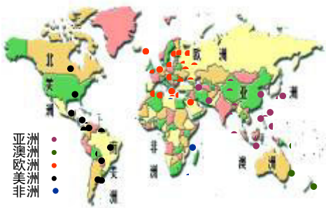
法轮大法洪传国家和地区

后的今天，全球近百个国家和地区一亿人修炼法轮功，《转法轮》被翻译成二十多种文字，深受各族裔人士的喜爱，“五·一三”已成为世界性节日。