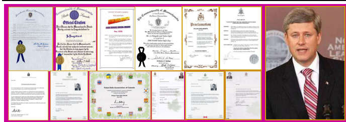
左：部分褒奖和贺信 右：加国总理哈珀致信贺大法日