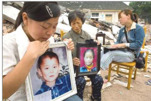
悲伤的遇难学生父母手捧孩子的照片

其实许多有识之士已经看出了中共的把戏，目的是为了利用人们目前的悲情，煽动人们对法轮功的仇恨，转移人们的视线，妄图让人们忘记由于中共的贪污腐败而造成地震的重大伤亡，造成那么多孩子们的死亡。