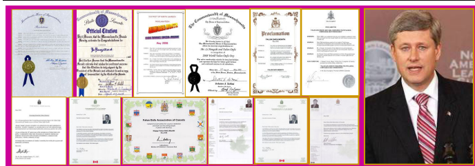
左：部分褒奖和贺信 右：加国总理哈珀致信贺大法日