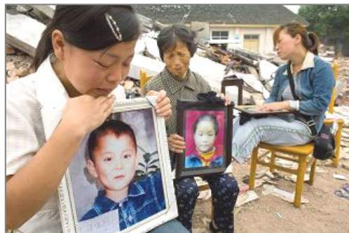
悲伤的遇难学生父母手捧孩子的照片

其实许多有识之士已经看出了中共的把戏，目的是为了利用人们目前的悲情，煽动人们对法轮功的仇恨，转移人们的视线，妄图让人们忘记由于中共的贪污腐败而造成地震的重大伤亡，造成那么多孩子们的死亡。