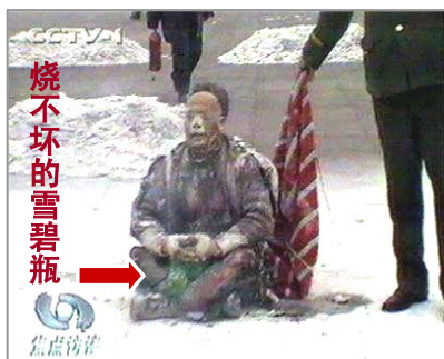
中共导演“自焚伪案”，煽动民众仇恨，为迫害法轮功制造借口

当然，中共的邪恶不是从这次四川大地震才开始的。《九评共产党》揭开了中共的画皮，由此触发的全国退党（团、队）大潮已经有至少三千七百万人退出了中共党团组织。加上这次大地震民众对中共人祸的怒吼，人们可以感到中共的恐慌和绝望。于是中共故伎重演，想办法来掩盖与混淆视听，企图