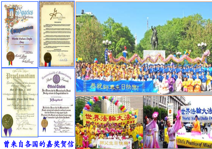
曾来自各国的嘉奖贺信

5月13日，是“世界法轮大法日”，是法轮大法开传的日子，也是法轮功创始人李洪志先生的华诞。十六年前的这一天，李洪志师尊在中国长春第一次把法轮大法面向社会传出，以“真善忍”法理，开启人们的心智，从此，亿万人找到期待已久、感恩不尽的高德大法，走上性命双修、返本归真的金光大道。