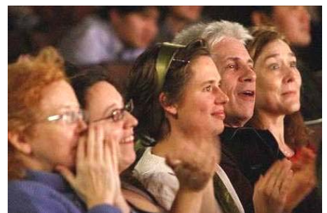
国外观众全身心地投入看演出

当第一个节目《万王下世》的大幕一拉开，满场观众就爆发出雷鸣般的掌声，随后在每个节目表演结束时，观众都报以长时间的热烈鼓掌，直到下一个节目报幕时才渐停止下来。其中当《觉醒》节目结束时，观众爆发出长时间的掌声，演员们在不断的掌声中二次谢幕。整