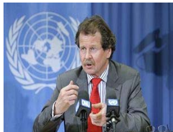
联合国酷刑问题特派专员诺瓦克先生 (Manfred Nowak)

据明慧网 2008 年 5 月 7 日的报道，两位联合国特派专员日前重申关于中共活体摘取法轮功学员器官的指控，并且再次要求中共政府就两个问题做出全面的解释。一是关于从法轮功学员身上摘取器官用于中国各大医院器官移植的指控；二是要求中共政