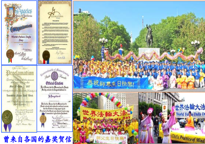
曾来自各国的嘉奖贺信

5月13日，是“世界法轮大法日”，是法轮大法开传的日子，也是法轮功创始人李洪志先生的华诞。十六年前的这一天，李洪志师尊在中国长春第一次把法轮大法面向社会传出，以“真善忍”法理，开启人们的心智，从此，亿万人找到期待已久、感恩不尽的高德大法，走上性命双修、返本归真的金光大道。