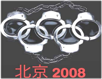
▲中共对外打着“反对把奥运政治化”的幌子，对内却借机加剧人权迫害，使奥运沦为名副其实的“手铐奥运”。

既然中共籍奥运之名加剧对大陆民众的人权迫害是无法否认的客观事实，那么接下来的一个问题是人们应不应该对此进行批评、抗议和抵制？我想，凡是有正义感的人都会予以肯定。毕竟对人权的迫害不但有违人权的普世价值和当今世界的发展潮流，也与奥运精神完全背道而驰。众所周知，“维护人类尊严”、“尊重世界基本道德原则”始终是《奥林匹克宪章》的核心原则，除去 1936 年法西斯德国举办的“柏林奥运”，百年多来的奥运一直是全世界人民不分人种、不分信仰、不论政治观点，公平竞争的一场盛大竞技活动，是追求和平自由幸福的人们共襄盛举的体育狂欢。显而易见，一边声称在举办奥运前要改善人权状况，开放新闻的自由度，一边却借奥运之名肆无忌惮的把大批无辜民众投入看守所、劳教所和监狱，这样的“手铐奥运”、“血腥奥运”与象征自由平等和平的奥运可以说完全是