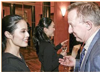
▲多位瑞典政要在本国观看了神韵演出，国会议员斯特凡·丹尼逊表示，演出汇集了中国传统精华。图为他与神韵演员交谈。