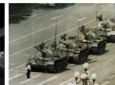
1989: 屠杀学生 Tiananmen Square Massacre