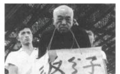
1957: 反右派斗争 Anti-Rightist Campaign