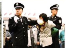
1999 — Present: 对法轮功的群体灭绝 Violent Suppression of Falun Gong