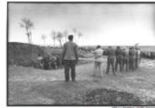
1949 — 1951: 消灭地主、资本家 "Eliminate Landlords & Capitalists"

我跟一个最好的朋友谈起这事，他说：“是可笑，真是可笑，其实可笑的岂止你一人，无数中国人都