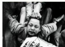
1966 — 1976: 文化大革命 Culture Revolution