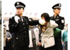
1999 — Present: 对法轮功的群体灭绝 Violent Suppression of Falun Gong

仍然盯着他们。我在盘算，只有 50 元钱怎么办。见我没有动，高个子想了想，又拿出 50 元给我。我拾起地上的钱，禁不住有点感激，说了声“谢谢”，赶紧调头走了。