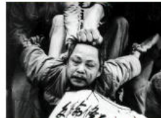
1966 — 1976: 文化大革命 Culture Revolution