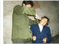
1951 — Present: 镇压宗教人士 "Stamp out Religions"