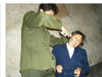
1951 — Present: 镇压宗教人士 "Stamp out Religions"