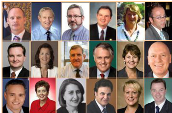
▲神韵晚会为澳洲观众带来了中华传统文化的纯善纯美。澳大利亚六十多位政要致信欢迎神韵纽约艺术团到来，并祝贺演出圆满成功。