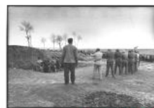
1949 — 1951: 消灭地主、资本家 "Eliminate Landlords & Capitalists"

我跟一个最好的朋友谈起这事，他说：“是可笑，真是可笑，其实可笑的岂止你一人，无数中国人都