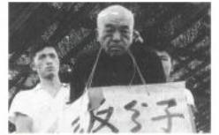
1957: 反右派斗争 Anti-Rightist Campaign