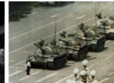
1989: 屠杀学生 Tiananmen Square Massacre