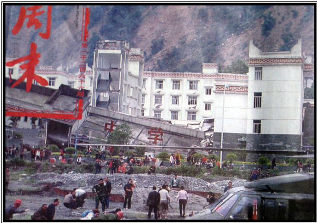
倒塌的中学后面