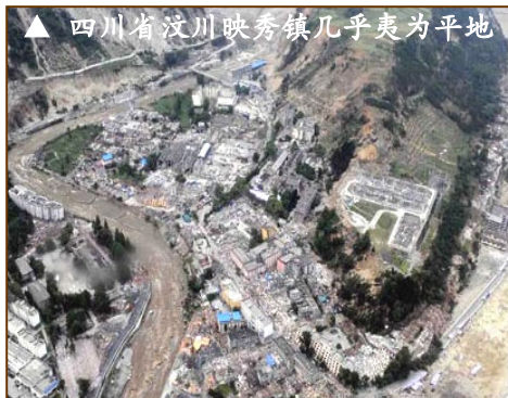
▲ 四川省汶川映秀镇几乎夷为平地

在几分钟内夺走了三十万人的性命。但是，也有一少部份人幸免于难，那是因为在大海啸到来之前的十多分钟，海平面突然下降，许多原本在海里的贝壳都露了出来，大家都抢着捡漂亮的贝壳，然而有经验的人却知道这是危险来临的前兆，就让大家快跑，只有极少数人相信他的话赶快离开了。可绝大多数人根本不信，还埋怨此人搅了大家捡贝壳的兴致与心情，结果海啸一到，这些不相信的人瞬间就失去了宝贵的生命。