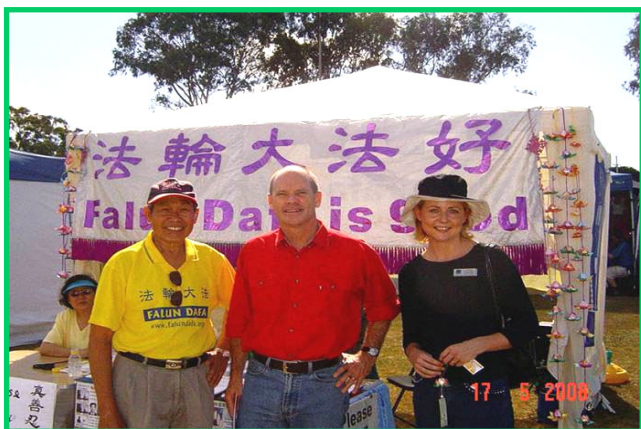
澳洲布里斯本市长坎博尔 (右二) 鼓励法轮功学员

【明慧网】五月十七日，澳洲布里斯本的法轮功学员参加了一年一度的齐米尔多元文化节庆祝活动。在上百个摊位中，写有“法轮大法好”的摊位特别引人注目，很多人前来了解大法的美好和中共迫害法轮功的真相，有上千的民众签下自己的名