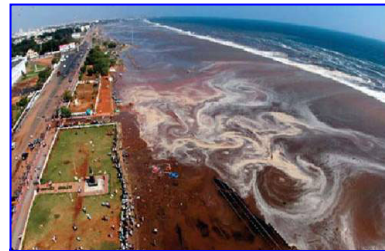
2004年印度洋海啸，30多万人丧生。海啸来临前，很多游客认为当地人的提醒扫了他们游玩的兴致。