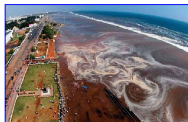
2004年印度洋海啸，30多万人丧生。海啸来临前，很多游客认为当地人的提醒扫了他们游玩的兴致。