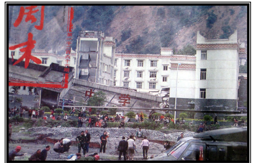
《南方周末》图片：倒塌的中学后面露出了坚固豪华的办公楼