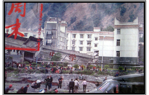
倒塌的中学后面露出了坚固豪华的办公楼

当然在震后的抢险救灾中，中共领导亲临现场，很多善良的中国人就忘记了中共骨子里的假、大、空、谎言、欺骗、不顾百姓的安危换取执政地位稳定