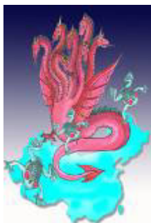
圣经启示录描述一条“大红(赤)龙，七头十角，七头上戴着七个冠冕

很久很久以前，有一个村庄的人已经变得很坏了，人们几乎都不信佛了。天意就将毁了这个村庄。那时的地藏菩萨还想挽救有善心的人，想再给人一次机会，就幻化成一个要饭的，到村里挨家儿挨户的乞讨，寻找信佛的人。可没有人肯给一口饭吃。