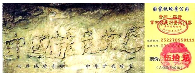
图为藏字石风景区门票：“中国共产党亡”清晰可见 《九评》掀起3700万退党大潮

如果读者感兴趣，可以参照《史记·秦始皇本纪》。读历史，便联想到现实，古代有预言，现代一样也有。零二年六月“藏字石”在贵州省平塘县掌布乡被发现，巨石上清晰可见“中国共产党亡”六个横排大字。据专家考证“藏字石”形成于两亿多年前，绝无任何人工雕琢、塑造、粘贴的痕迹。“藏字石”上的“中国共产党亡”，正是上天对人明示中共必将灭亡。◇