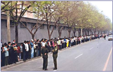
▲四.二五上访现场，法轮功学员文明安静，警察不用维持秩序，在一旁聊天。学员背后不是中南海红墙，所谓的“围攻中南海”根本不存在。

一九九九年四月二十三日，天津市公安局殴打和非法逮捕当地法轮功学员。学员在天津市政府被告知，公安部介入了此事，你们去北京才能解决问题。