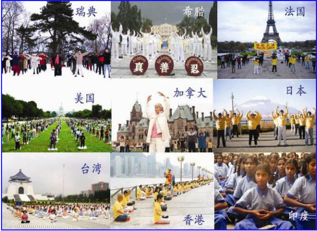
自1992年传出后，修炼人数呈几何增长，至1999

1995年3月和5月，李洪志老师应邀到法国和瑞典传功讲法，拉开了法轮大法在海外洪传的序幕。