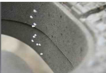
世界各地开在仙人掌、水泥墙、 玻璃、钢管上的婆罗花