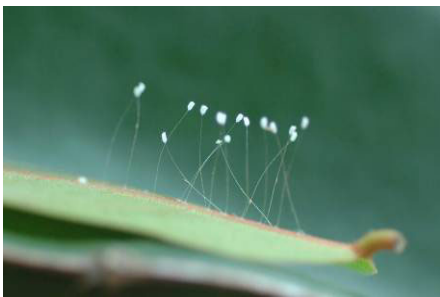
2007 年 10 月 18 日在广州增城发现 的长在一花茎上的优昙婆罗花