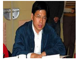
中国文化部刘军宁

2007年10月26日，安徽省政协常委汪兆钧发表四万字的致胡锦涛、温家宝公开信，信中呼吁：