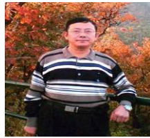
安徽政协常委汪兆钧