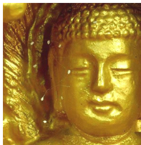
1997 年优昙婆罗花 在韩国首次被发现