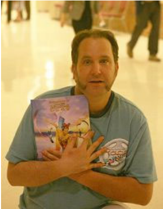
电视制作人：感觉到中华文化的博大和震撼力，神韵晚会正在改变世界

而神韵晚会，这场世界级的演出，将在托希尔表演艺术中心展示中国传统艺术的精华；由于神韵晚会主办者“希望之声”是一个非盈利的广播电台，长期以来服务社区，为听众提供包括新闻和文化交流等广泛内容；主办者“美中法轮大法学会”致力于推广“真、善、忍”普世原则，因此，圣路易市议会通过决议，欢迎二零零八年神韵晚会光临本市。