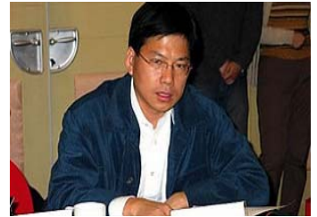
中国文化部刘军宁

2007 年 10 月 26 日，安徽省政协常委汪兆钧发表四万字的致胡锦涛、温家宝公开信，信中呼吁：