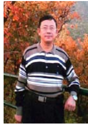
安徽政协常委汪兆钧