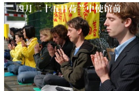
四月二十五日荷兰中使馆前