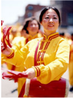
法轮功学员在社区游行中表演腰鼓

“因为法轮功能够使人身体健康、精神受益，所以炼功者日益增多。据统计，到一九九九年，中国国内有近一亿人在学炼法轮功，其数字远远超过中共党员的人数，这便引起了中共的极度恐慌。一九九九年七月二十