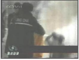
3、手摸被打后的头部