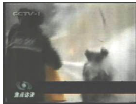
2、击打后飞出的重物