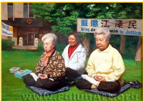
▲ 油画《正义之场》。一群炼法轮功的老妈妈在中国驻美大使馆前的草坪上炼功，默默地告诉世人“法轮大法好”。天长日久，感动了世人，成为了城市的一道风景。

在十堂课期间，师父为我净化身体，一个个神奇的事不断出现：排了腹水、心脏病有很大好转。修大法后，我的整个世界观发生了改变，身体发生了巨大变化：人变的年轻了，皮肤变的细嫩，头发长多了，白头发掉了，长出的全是黑发，脸上的斑块消失了，我现在六十多岁，看上去只有五十多岁。修大法的这十多年我才真正体会到无病一身轻