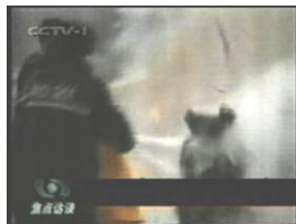
2、击打后飞出的重物