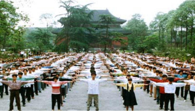
▲图为成都法轮功学员在南郊公园晨炼

法轮大法由李洪志老师于一九九二年五月十三日在长春传出，到一九九九年短短七年间就有上亿人修炼法轮功，凡真修者都得到一个好的身体，高尚的思想，人们都自觉的用真善忍来要求自己。被誉为利国利民、有百利而无一害的高德大法。一九九九年七、二零之前全国各大小公园、绿地、广场均可看到法轮功壮观的炼功场面。