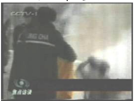
3、手摸被打后的头部