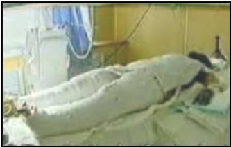
《焦点访谈》中的“自焚者”被包裹得严密。

国际教育发展组织(IED) 二零零一年八月在联合国会议上的正式声明指出：中共企图以天安门广场上的自焚事件来诬陷法轮功。我们得到一份录像分析表明，整个事件是由政府一手导演的。