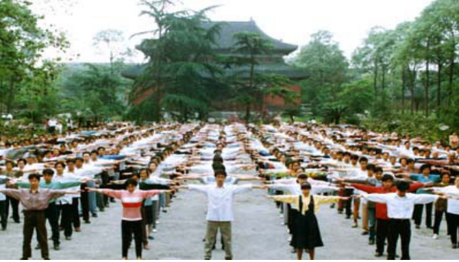
▲图为成都法轮功学员在南郊公园晨炼

法轮大法由李洪志老师于一九九二年五月十三日在长春传出，到一九九九年短短七年间就有上亿人修炼法轮功，凡真修者都得到一个好的身体，高尚的思想，人们都自觉的用真善忍来要求自己。被誉为利国利民、有百利而无一害的高德大法。一九九九年七、二零之前全国各大小公园、绿地、广场均可看到法轮功壮观的炼功场面。