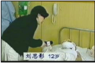
气管切开还能说、唱？ 记者采访不穿防护服， 不戴口罩？