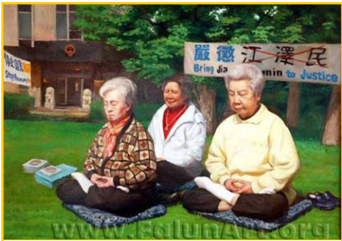
▲ 油画《正义之场》。一群炼法轮功的老妈妈在中国驻美大使馆前的草坪上炼功，默默地告诉世人“法轮大法好”。天长日久，感动了世人，成为了城市的一道风景。

在十堂课期间，师父为我净化身体，一个个神奇的事不断出现：排了腹水、心脏病有很大好转。修大法后，我的整个世界观发生了改变，身体发生了巨大变化：人变的年轻了，皮肤变的细嫩，头发长多了，白头发掉了，长出的全是黑发，脸上的斑块消失了，我现在六十多岁，看上去只有五十多岁。修大法的这十多年我才真正体会到无病一身轻