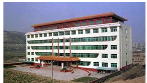
山西省沁水县瑞氏镇 政府办公大楼