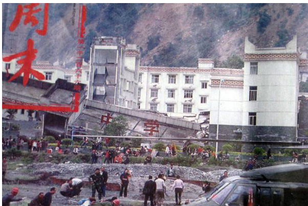
图片报道倒塌的中学后面露出了坚固豪华的办公楼

附：二零零六年八月十日“国家信息中心，经济预测部，政策动向课题组”的一篇文章《收入制度改革，一场静悄悄的革命》披露零四年用于公款消费的财政支出情况，您可查证。◇