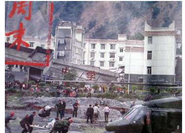
图：倒塌的中学后面是政府坚固豪华的办公楼

大地震中，大部份校舍倒塌，砸死了很多孩子。不管是老校舍还是新校舍，都在地震中倒了。而中共官员很少有死的，中共的办公大楼很少像学校那样倒塌的。十几年前，克拉玛依发生火灾，“让领导先走”的命令使得几百个孩子被烧死、闷死，而领导们全逃脱了。现在中共依然是榨取人民的血汗，自己住和办公在豪华的房子里。共产党的唯一目的就是维持自己的统治，采用的是一贯的谎言和暴力的方式。尽管目前