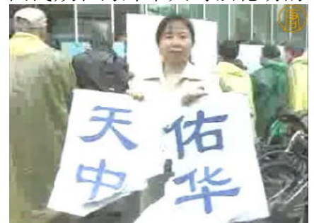
「纽约退党中心」的义工，她手中的「天佑中华」的标语牌被中共收买的暴徒撕毁。

在中领馆的幕后组织下（中领馆用海外赈灾捐款收买一伙华人暴徒），五月十七日，暴徒大规模骚扰和围攻纽约退党服务中心，并殴打退党服务中心员工。此后数日，在法拉盛的《九评共产党》资料点连续发生严重恶性围攻和威胁工作人员的事件。