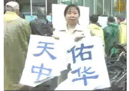
「纽约退党中心」的义工，她手中的「天佑中华」的标语牌被中共收买的暴徒撕毁。

在中领馆的幕后组织下（中领馆用海外赈灾捐款收买一伙华人暴徒），五月十七日，暴徒大规模骚扰和围攻纽约退党服务中心，并殴打退党服务中心员工。此后数日，在法拉盛的《九评共产党》资料点连续发生严重恶性围攻和威胁工作人员的事件。