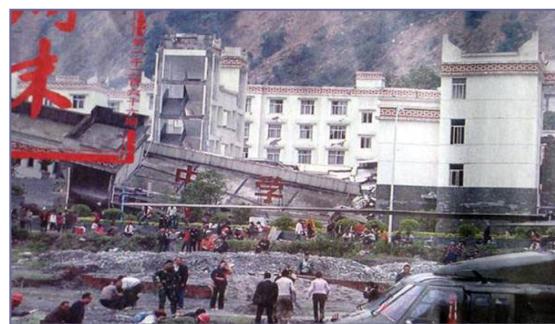
倒塌的中学后面露出坚固豪华的办公楼

近半学生死， 校舍多倒塌。 拿起水泥块， 一攥碎哗啦。 偷工又减料， 如同豆腐渣。 政府办公楼， 坚固又豪华。