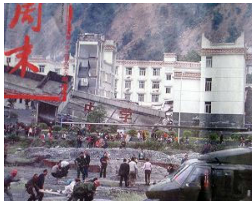
倒塌的中学后面露出了坚固豪华的办公楼