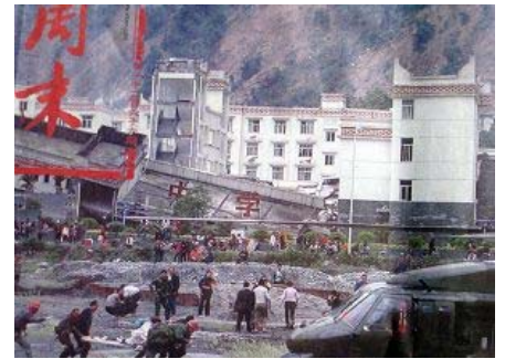
图：倒塌的中学后面是政府 坚固豪华的办公楼

共产党的救灾宣传不是集中在报道灾区的灾情和需要上，而是集中在共产党及其领导、军队在救灾上如何“伟大”，使得外界不能更详细了解灾区的严重灾情，以便更多的提供支援，致使几天过去了许多地方还是没有得到救援，灾民的生命越来越被共产党耽误。