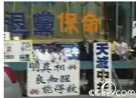
► 中共央视网图片，可见“退党保命”、“天灭中共”标语，证实当日是声援退党集会的现场，而不是被中共编造的纽约人为赈灾的筹款会。（网路截图）

五月十七日（星期六）下午，全球退出中共服务中心在法拉盛缅街图书馆前举办“声援海内外三千六百万华人勇士退出中共”的集会。在周永康的授意下，中共特务进行捣乱，其中有中共唆使的肇事者暴力攻击，殴打一位七十岁高龄的退休华人工程师。还有肇事者在攻击现场用电话传呼更多人来加入袭击，在电话中直呼：“快叫更多人来，一个人九十元”。甚至连纽约亲中共媒体《世界日报》在五月十九日，就此事件的新闻报导中，标题是“法轮功批中共”，此报导只字未提“震灾募捐”，当天现场没有震灾募捐。