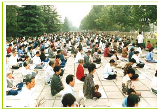
北京法轮大法学员一次大炼功场景，约二千人参加

办了第一期学习班，将法轮大法公诸于世。法轮大法以宇宙特性“真善忍”指导人修心向善，从根本上祛除病疾、净化身心灵，使真修者最终达到返本归真的境界。