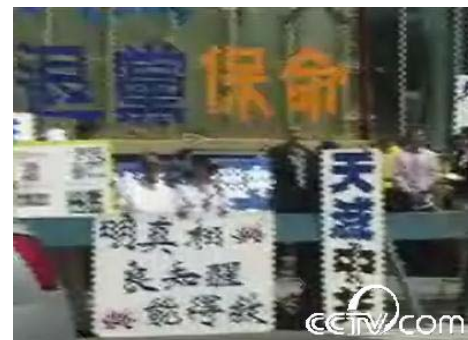
► 中共央视网图片，可见“退党保命”、“天灭中共”标语，证实当日是声援退党集会的现场，而不是被中共编造的纽约人为赈灾的筹款会。

五月十七日（星期六）下午，全球退出中共服务中心在法拉盛缅街图书馆前举办“声援海内外三千六百万华人勇士退出中共”的集会。在周永康的授意下，中共特务进行捣乱，其中有中共唆使的肇事者暴力攻击，殴打一位七十岁高龄的退休华人工程师。还有肇事者在攻击现场用电话传呼更多人来加入袭击，在电话中直呼：“快叫更多人来，一个人九十元”。甚至连纽约亲中共媒体《世界日报》在五月十九日，就此事件的新闻报导中，标题是“法轮功批中共”，此报导只字未提“震灾募捐”，当天现场没有震灾募捐。