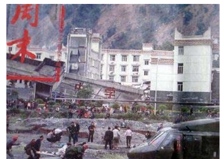
图：倒塌的中学后面是政府 坚固豪华的办公楼

共产党的救灾宣传不是集中在报道灾区的灾情和需要上，而是集中在共产党及其领导、军队在救灾上如何“伟大”，使得外界不能更详细了解灾区的严重灾情，以便更多的提供支援，致使几天过去了许多地方还是没有得到救援，灾民的生命越来越被共产党耽误。