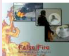
揭露自焚的影片《伪火》获第51届哥伦布国际电影节荣誉奖。