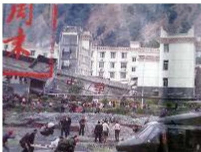
图：倒塌的中学后面是政府坚固豪华的办公楼

大地震发生时，72 小时特别是 24 小时之内，是救人的黄金时期。但是共产党尽管在宣传上显得非常迅速、积极的救援灾民，但是却迟迟的不进入震中地区，坐失最佳的救援时机，许多人民的生命就这样失去了。根据目前了解到的消息，知道有旅行团的导游、台湾游客，四川的中年妇女等不同的人，在地震发生后，分别用不到 10 个小时甚至几个小时的时间，就从震中地区走到了都江堰之外等安全地带。尽管共产党声称天气原因、余震原因、道路原因等等，但是训练有素的军队居然不如上了年纪的一般人甚至是妇女吗？因此共产党实际上是真作秀，假救灾。