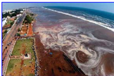
2004年印度洋海啸，30多万人丧生。海啸来临前，很多游客认为当地人的提醒扫了他们游玩的兴致。