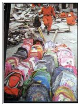
▲在学校废墟中收集的小学生书包，待父母认领

汶川地震死亡已经超过两万，从电视上看到，灾区震塌的多是中小学校舍，压死的多是少年学生。《南方日报》记者到了灾区绵竹的洛水中学，一位带队者对他说：“这个镇震死的都是这个学校里的娃娃，太多了，大人死也就死了，可……，”记者描述，挖出的孩子们都被送到了镇政府，政府打开5个仓库全部摆放他们的遗体。从这里可以看到镇政府和它的车库都没有坍塌，