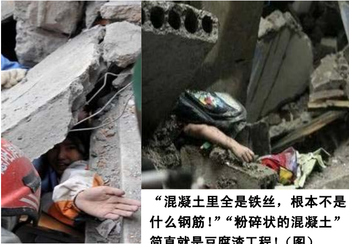
“混凝土里全是铁丝，根本不是什么钢筋！”“粉碎状的混凝土”简直就是豆腐渣工程！（图）

据美联社报道：在地震中聚源镇的聚源中学有将近 900 名学生被埋在聚源中学的废墟中。地震四天之后，仅有一小部分学生被从废墟中抢救出来。该中学的四层教学楼垮塌并导致数百名学生死亡，而附近的楼房却依然站立着。