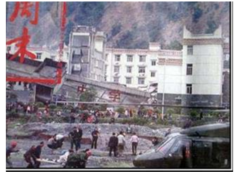
▲老旧灰暗的中学教学楼倒塌了，后面露出光亮气派的办公楼（四川省汶川县）

在中国，宣传机器，常把中国少年比作国家花朵、说成祖国的未来，为什么来了地震，受灾的却主要是少年？为什么多数有权有势的人可以安然无恙？为什么，中小学校舍大片的倒塌，而政府办公楼却多岿然不动？现在小学生之死接连不断地展现