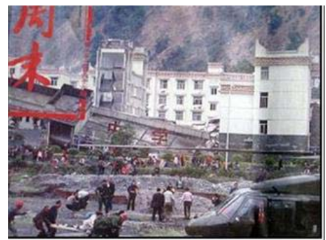
▲老旧灰暗的中学教学楼倒塌了，后面露出光亮气派的办公楼（四川省汶川县）