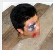
酷刑演示图：吉林监狱残害学员的酷刑—“上枷锁”并被毒打。