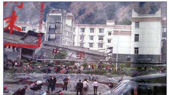
倒塌的中学后面露出坚固豪华的办公楼

近半学生死， 校舍多倒塌。 拿起水泥块， 一撮碎哗啦。 偷工又减料， 如同豆腐渣。 政府办公楼， 坚固又豪华。