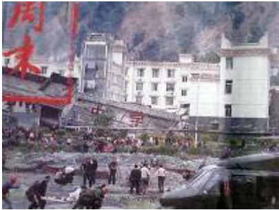
图：倒塌的中学后面是政府坚固豪华的办公楼

大地震发生时，72 小时特别是 24 小时之内，是救人的黄金时期。但是共产党尽管在宣传上显得非常迅速、积极的救援灾民，但是却迟迟的不进入震中地区，坐失最佳的救援时机，许多人民的生命就这样失去了。根据目前了解到的消息，知道有旅行团的导游、台湾游客，四川的中年妇女等不同的人，在地震发生后，分别用不到 10 个小时甚至几个小时的时间，就从震中地区走到了都江堰之外等安全地带。尽管共产党声称天气原因、余震原因、道路原因等等，但是训练有素的军队居然不如上了年纪的一般人甚至是妇女吗？因此共产党实际上是真作秀，假救灾。