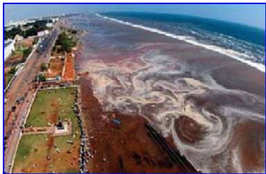
2004 年印度洋海啸，30 多万人丧生。海啸来临前，很多游客认为当地人的提醒扫了他们游玩的兴致。

村口有个老太太正在给佛上香，老太太说：“就这一碗饭了，给你半碗吧，留下半碗还得给佛上供呢。”地藏菩萨一看老太太心地善良，临行时就指着村口的一对儿石狮子对她说：“什么时候这对儿