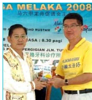
▲主办方给参赛的法轮功学员代表（右）颁奖

【明慧网】马来西亚“马六甲龙舟金杯锦标赛”于二零零八年六月一日在马六甲河畔举行，当地法轮功学员组成女子队和男子队参加了这项传统文化活动，并分别获得精神奖和纪念奖。主办单位特别安排新加坡法轮功学员组成的腰鼓队表演中华传统腰鼓舞，令龙舟赛更添欢乐气氛。