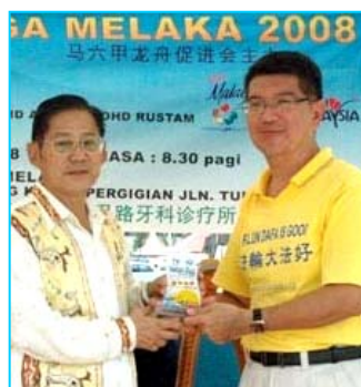
▲主办方给参赛的法轮功学员代表（右）颁奖

【明慧网】马来西亚“马六甲龙舟金杯锦标赛”于二零零八年六月一日在马六甲河畔举行，当地法轮功学员组成女子队和男子队参加了这项传统文化活动，并分别获得精神奖和纪念奖。主办单位特别安排新加坡法轮功学员组成的腰鼓队表演中华传统腰鼓舞，令龙舟赛更添欢乐气氛。