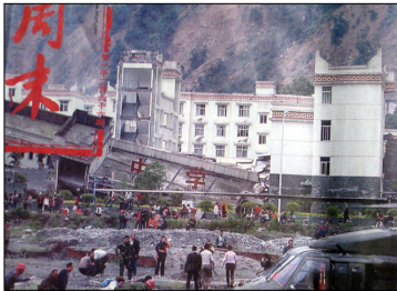
倒塌的中学后面露出了坚固豪华的办公楼

5.12 四川大地震中，灾区倒塌的多是中小学校舍，而周围的政府办公楼安然无恙，这到底是天灾，还是人祸？