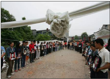
地震死难学童父母请愿惩罚“豆腐渣工程”责任人

太多证据表明：此次大地震早已有多方专家准确预测且通报中共高层。如： 1. 中国的地震科学家耿庆国预报了阿坝地区将发生 7 级以上地震，他明确提出“阿坝地区 7 级以上地震的危险点在 5 月 8 日（前后十天以内）”，并多次通报高层。2008 年 5 月 3 日，陈一文(中国地球物理学会天灾预测专业委员会顾问)亲手又向中国地震局发了一份汶川地区可能发生强震的预报。