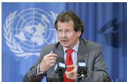
联合国酷刑问题特派专员诺瓦克先生 (Manfred Nowak)

据明慧网二零零八年五月七日的报道，两位联合国特派专员日前重申关于中共活体摘取法轮功学员器官的指控，并且再次要求中共政府就两个问题做出全面的解释。一是关于从法轮功学员身上摘取器官用于中国各大医院器官移植的指控；二是要求中共政府拿出从二零零零年开始中国器官移植数量猛增所用的器官的来源。特派专员指出二零零零年到二零零五年之间是法轮功学员被迫害最残酷的阶段，这也是中国器官移植手术暴增的阶段。