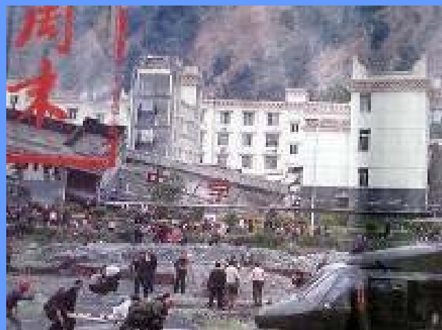
▲老旧灰暗的中学教学楼倒塌了, 后面露出光亮气派的办公楼 (四川省汶川县)