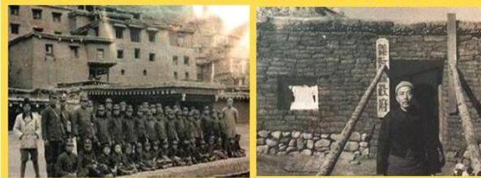
30年代四川的德格县的小学（左）和义敦县县政府（右）

试想，如果当今的县长还有一点刘主席的重教的思想，此次汶川地震，还会有那么多的学校顷刻间倒塌吗？