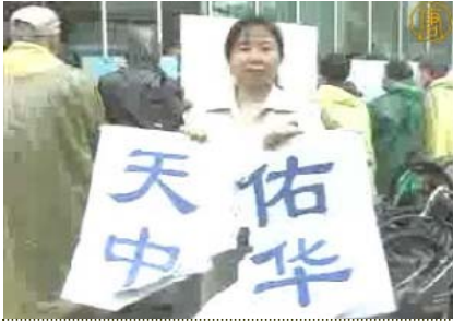
「纽约退党中心」的义工，她手中的「天佑中华」的标语牌被中共收买的暴徒撕毁。