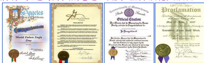
上图在美、加各级政府发来的贺状褒奖法轮大法。

1992年5月13日，是法轮大法开传的日子，也是法轮功创始人李洪志师尊的华诞。十六年前的这一天，李洪志师尊在吉林长春首次把法轮大法面向社会传出，以“真善忍”为修炼原则，开启人们的心智，使上亿人的道德回升，体魄强健。法轮大法至今已洪传世界80多个国家和港澳台地区，至2008年3月，各国政府机构、团体组织对法轮大法及其创始人颁发的褒奖与支持议案信函已达2945项。法轮功主要著作《转法轮》、《法轮功》已翻译成30种语言在世界各地出版发行。并可在计算机网络上免费下载、复制。2000年5月13日，第一个“世界法轮大法日”诞生。每年的这一天，美、欧、亚、澳洲的各国法轮功学员举行盛大游行、文艺演出等活动，表达对师父的感恩，欢庆“世界法轮大法日”。