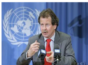
联合国酷刑问题特派专员诺瓦克先生 (Manfred Nowak)

据明慧网 2008 年 5 月 7 日的报道，两位联合国特派专员日前重申关于中共活体摘取法轮功学员器官的指控，并且再次要求中共政府就两个问题做出全面的解释。一是关于从法轮功学员身上摘取器官用于中国各大医院器官移植的指控；二是要求中共政府拿出从 2000 年开始中国器官移植数量猛增所用的器官的来源。特派专员指出 2000 年到 2005 年之间是法轮功学员被迫害最残酷的阶段，这也是