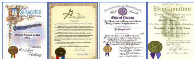
上图在美、加各级政府发来的贺状褒奖法轮大法。

1992年5月13日，是法轮大法开传的日子，也是法轮功创始人李洪志师尊的华诞。十六年前的这一天，李洪志师尊在吉林长春首次把法轮大法面向社会传出，以“真善忍”为修炼原则，开启人们的心智，使上亿人的道德回升，体魄强健。法轮大法至今已洪传世界80多个国家和港澳台地区，至2008年3月，各国政府机构、团体组织对法轮大法及其创始人颁发的褒奖与支持议案信函已达2945项。法轮功主要著作《转法轮》、《法轮功》已翻译成30种语言在世界各地出版发行。并可在计算机网络上免费下载、复制。2000年5月13日，第一个“世界法轮大法日”诞生。每年的这一天，美、欧、亚、澳洲的各国法轮功学员举行盛大游行、文艺演出等活动，表达对师父的感恩，欢庆“世界法轮大法日”。