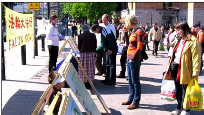
往来的民众观看展板，了解真相，签名声援法轮功

【明慧网】零八年五月二十四、二十五日两天，芬兰部份法轮功学员在首都赫尔辛基火车站旁拉起“法轮大法好”、“立即停止迫害法轮功”等横幅和图片展板，并征集签名谴责中共对法轮功长达九年的残酷迫害。芬兰的法轮功学员几年来一直在周末坚持用这种和平、理性的方式向人们讲述真相，呼吁共同制止中共迫害法轮功。