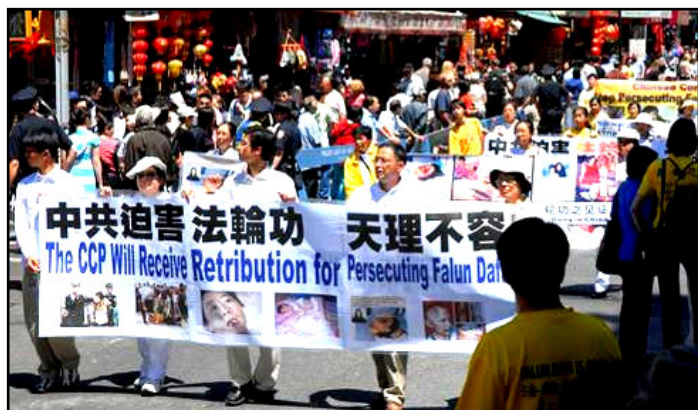
强烈呼吁民众制止中共迫害法轮功

【明慧网】二零零八年五月二十五日中午十二点，两千余名法轮功学员及社会正义人士在曼哈顿唐人街举行盛大游行，展示法轮大法洪传世界八十多个国家与地区的美好，并以巨幅标语谴责中共利用四川地震这样的国难加剧迫害法轮功。游行队伍由三个方阵组成，威震四方的天国乐团为引导前锋，学员沿途派送法轮功真相资料，向华人社区民众讲解最近“法拉盛发生的由中领馆煽动仇恨而引起的对法轮功学员暴力攻击”的事实真相。街道两旁有不少热情民众欢呼迎接，许多人争相拍照游行队伍。