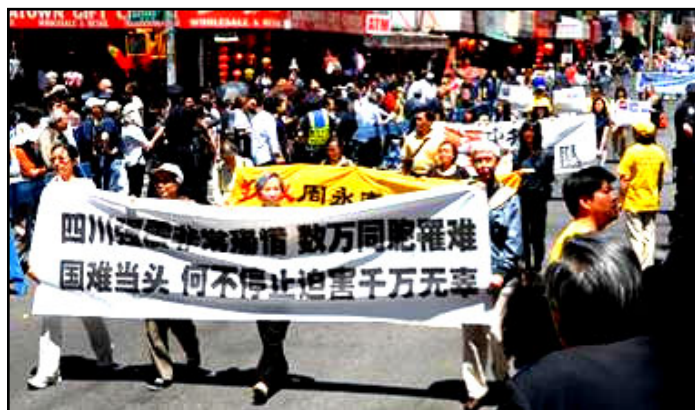
“国难当头，何不停止迫害千万无辜”