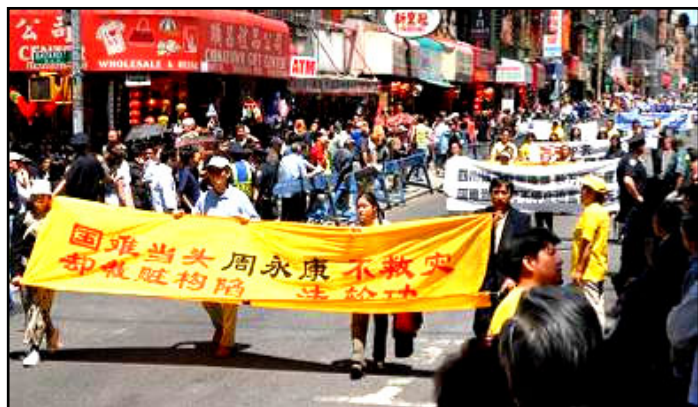
谴责中共利用四川地震加剧迫害法轮功