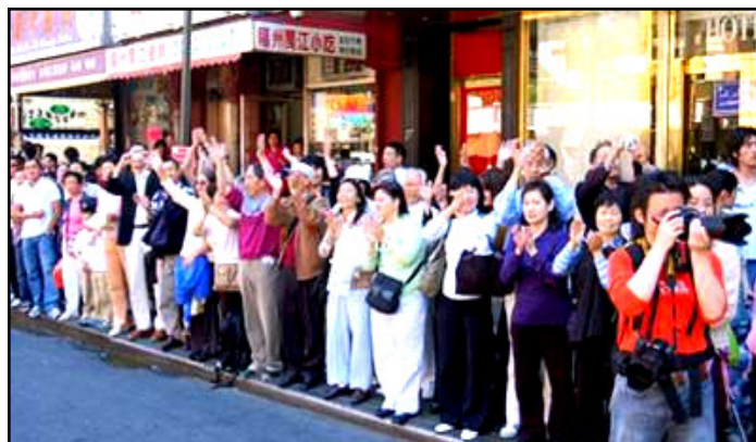
沿街支持法轮功的人们双手鼓掌