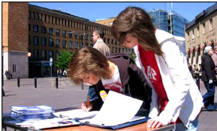
两个美丽的小姑娘都有一颗善良的心